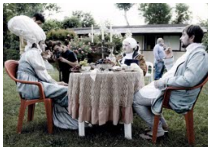
Un'immagine sul set del film "Adesso come adesso" di Michele Casiraghi

maschere e dei costumi d'epoca, in quella terra di nessuno dove la personalità è travolta dalle contraddizioni tra privilegio e assefazione. Adesso come adesso non è un documentario o un film di testimonianza: la spontanea interpretazione degli ospiti della comunità Il Pellicano, i veri protagonisti della pellicola, unita alla poetica delle immagini e delle luci e grazie rende l'opera una vera e propria visione metaforica e surreale che attraverso la rappresentazione teatrale e cinematografica prova a raccontare i sentimenti e le emozioni di persone che sognano una libertà o un silenzio, il massimo privilegio, in un'altro che non conoscono ed è solo il riflesso di una speranza. Alla lezione di Ludovica Lumer parteciperanno anche il regista Mi-