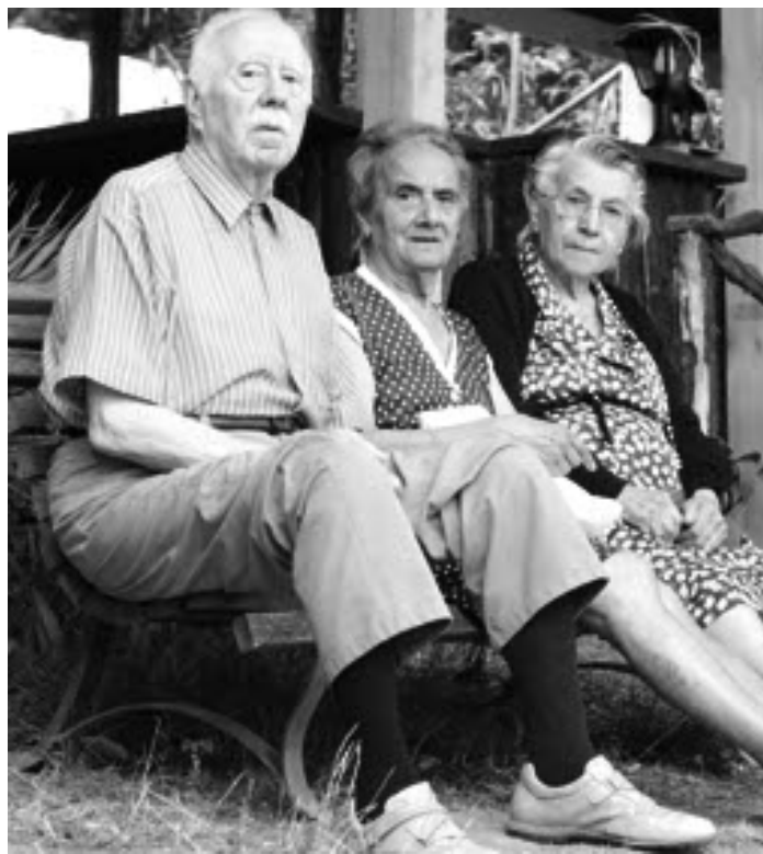
In linea con la tendenza nazionale anche la città di Lodi si scopre sempre più anziana: sono oltre 3mila i residenti ultraottantenni

Palazzo Broletto ha presentato l'indagine sul gradimento dei servizi erogati agli anziani